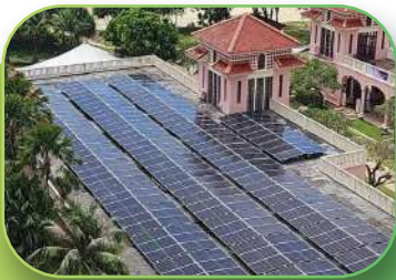
Hospitality, 571 Kw, Rooftop, Phuket