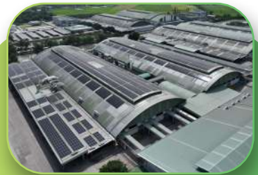
FMCG, 7.75 MWp, Rooftop, Prachinburi