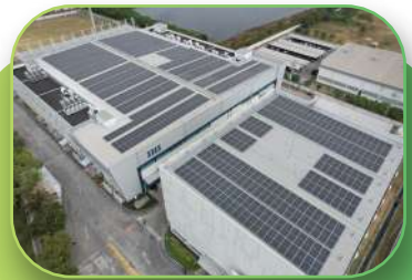
Automotive, 1.69 MWp, Rooftop, Chonburi