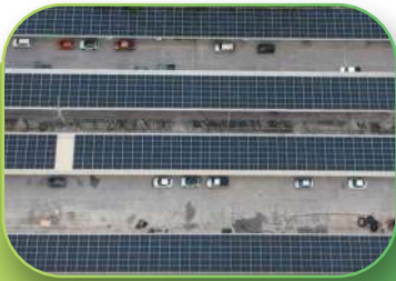
Household products, 629 KWp, Carport, Chonburi