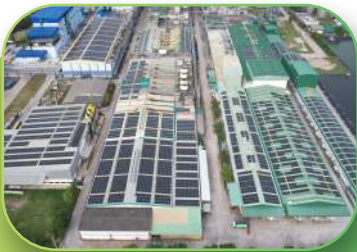
Petrochemical, 15 MWp, Rooftop and Floating, Rayong