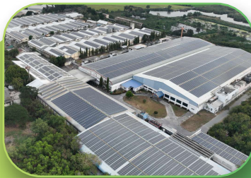
Apparel and Textile, 8MWp, Rooftop, Ayutthaya