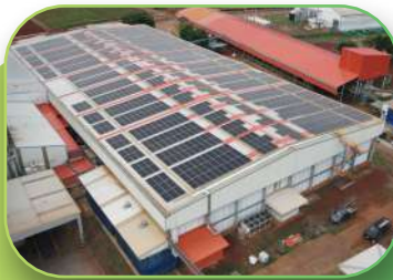
Pharmaceuticals, 568 Kw, Rooftop, Phitsanulok