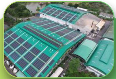
FMCG, 1MWp, Rooftop, Samut Sakorn