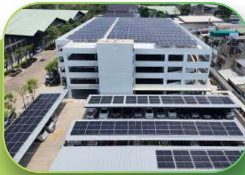
FMCG, 499KWp, Rooftop and Carport, Bangkok